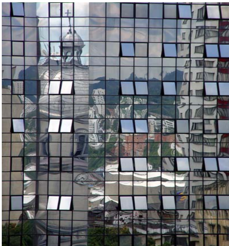
“FACHADA EDIFICIO BOLIVAR-PEREIRA”