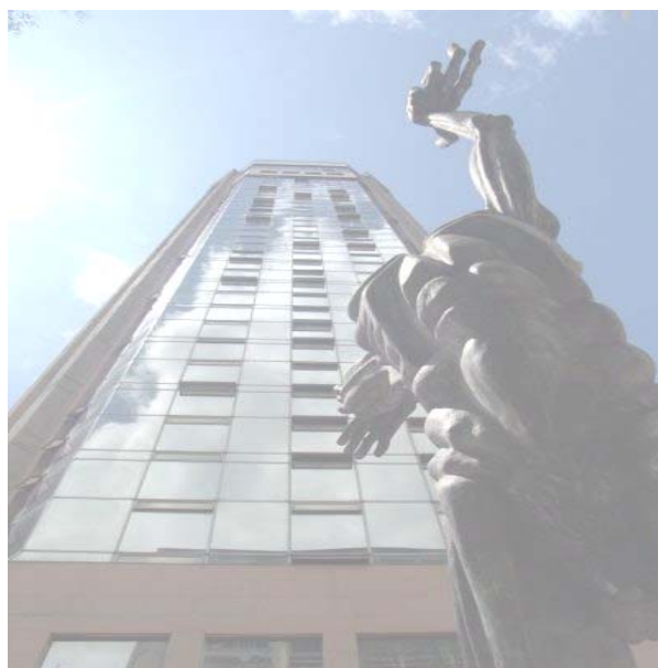
“EDIFICIO DIARIO DEL OTUN” PEREIRA