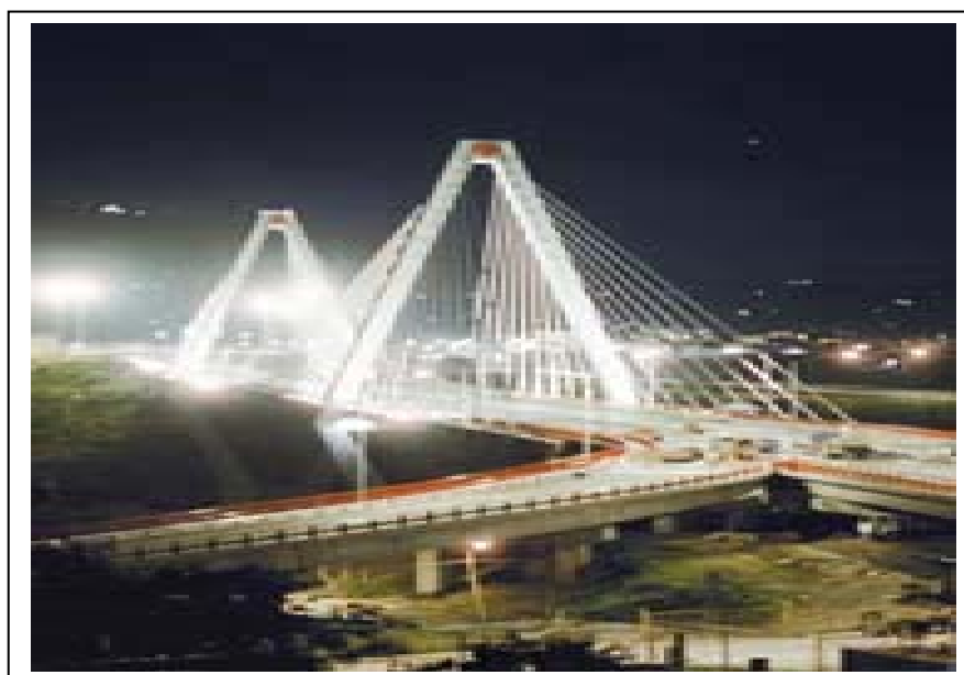
“VIADUCTO CESAR GAVIRIA TRUJILLO”