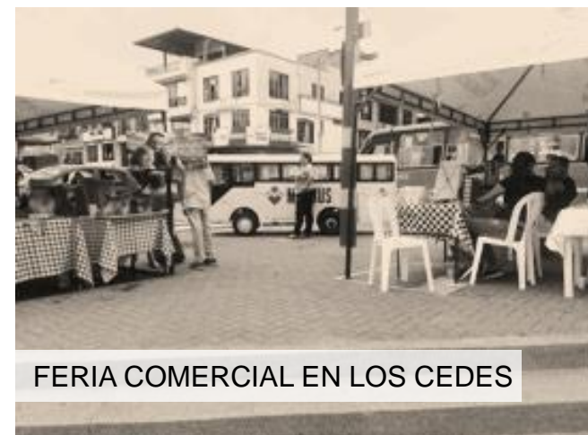
FERIA COMERCIAL EN LOS CEDES