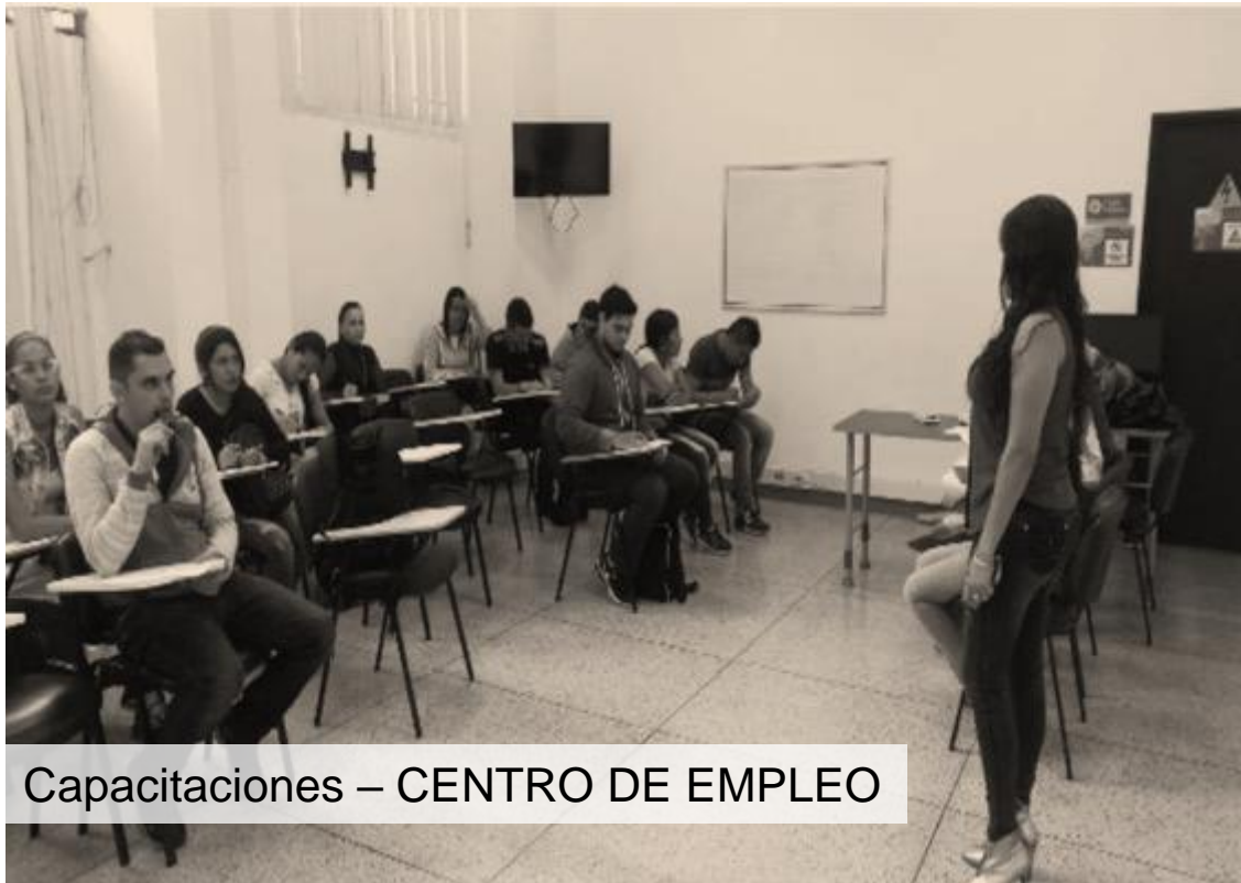
Capacitaciones – CENTRO DE EMPLEO

16 MINIMARATONES 3 MINIMARATONES DESCENTRALIZADAS (Parque industrial, Remanso y Consota)