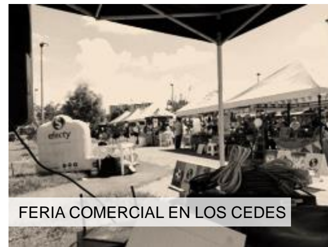
FERIA COMERCIAL EN LOS CEDES

26 ENCADENAMIENTOS COMERCIALES ENTRE MICROEMPRESARIOS