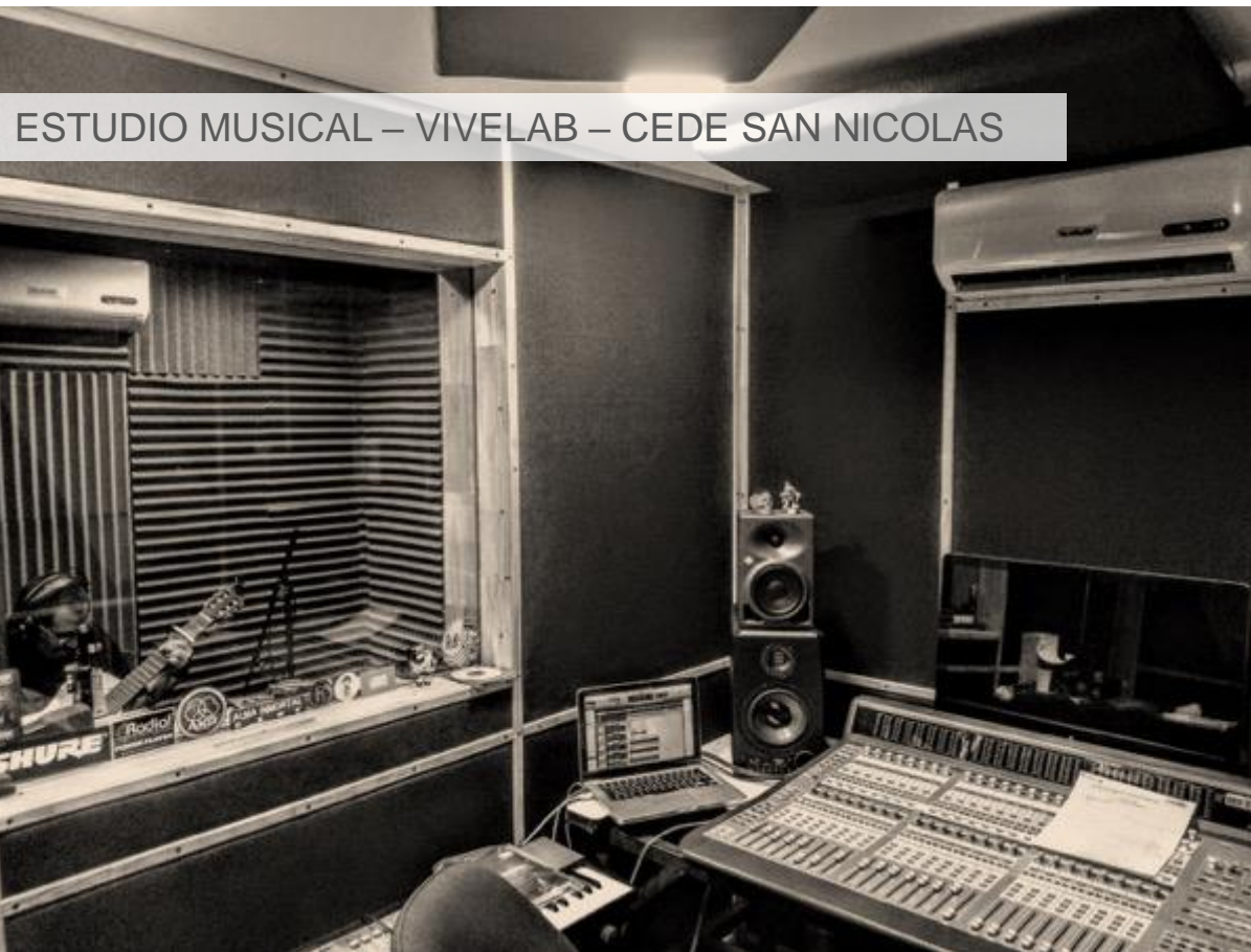
ESTUDIO MUSICAL – VIVELAB – CEDE SAN NICOLAS