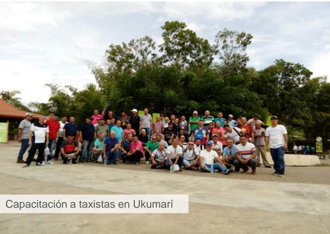
Capacitación a taxistas en Ukumarí