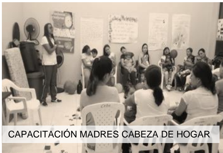
CAPACITACIÓN MADRES CABEZA DE HOGAR