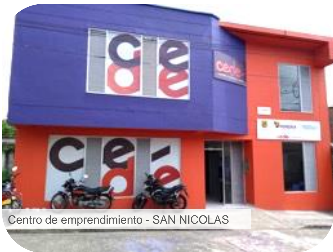
Centro de emprendimiento - SAN NICOLAS