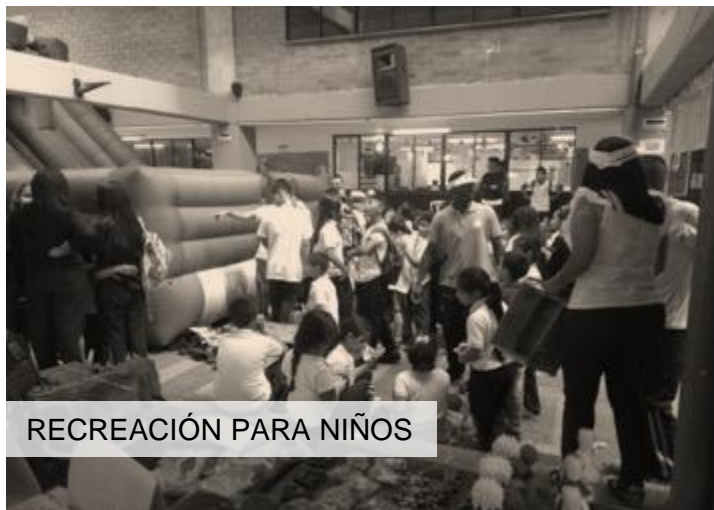
RECREACIÓN PARA NIÑOS