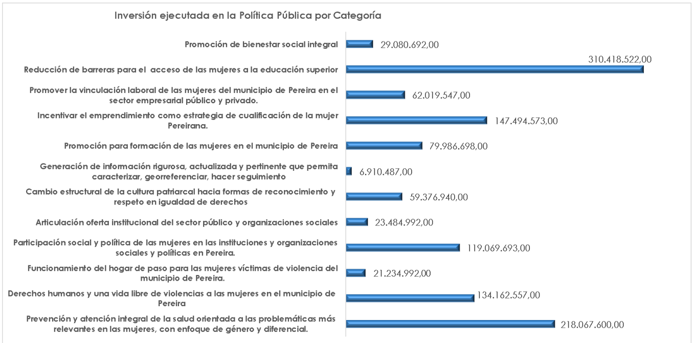
Gráfico 2. Inversión ejecutada año 2022, por objetivos estratégicos