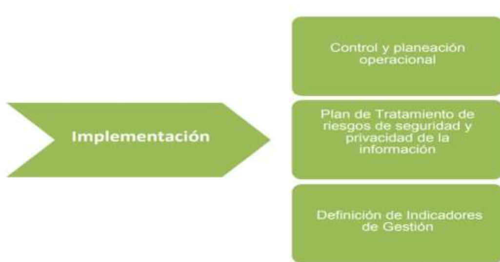
Figura 5 Fase de implementación 7

A continuación, se muestra en la Tabla 3 Avance fase de implementación, el tiempo estimado para la ejecución de la fase, las actividades que se deben ejecutar, la dependencia que lidera dicho proceso, las dependencias que por la envergadura de la fase se requiera de apoyo o complemento para la gestión y por último el porcentaje de avance específicamente para esta fase, es decir del 100% de la fase en que porcentaje se encuentra su desarrollo.