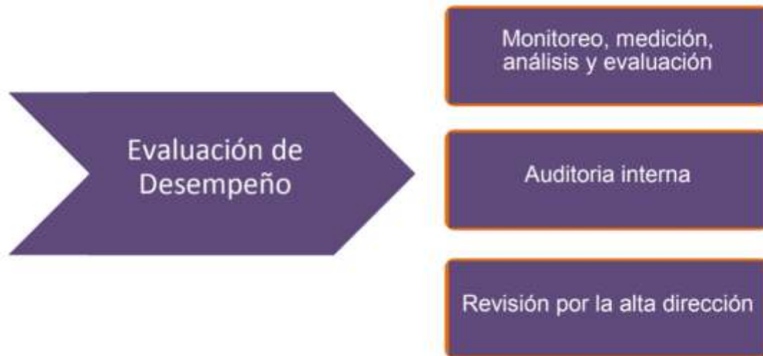
Figura 6 Fase de mejora continua 9

De esta fase corresponde realizar seguimiento a los indicadores al igual que verificación del alcance propuesto en la fase de planificación, también el resultado de las auditorías internas y externas generando un gran insumo hacia la toma de decisiones del Modelo de Seguridad y Privacidad de la Información.