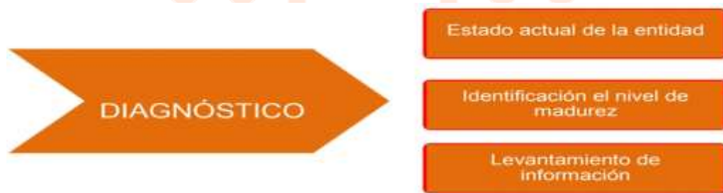
Figura 3 Fase de diagnóstico 3

La fase diagnóstica se ejecuta para conocer la situación actual de la entidad referente a la seguridad y privacidad de la información, en este caso se identifica el nivel de madurez, vulnerabilidades y otros aspectos que son relevantes y que demuestren la situación actual de la Alcaldía de Pereira. Esta fase se transforma en un insumo de vital importancia para la siguiente fase de planificación, entendiendo que cada fase está en concordancia con la siguiente siguiendo el ciclo de operación entre fases que se muestra en la Figura 1 Ciclo de operación del Modelo de Seguridad y Privacidad de la Información.