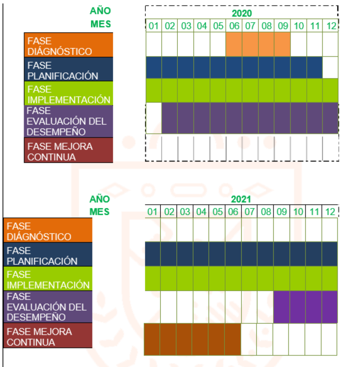
Tabla 6 Cronograma plan implementación del MSPI