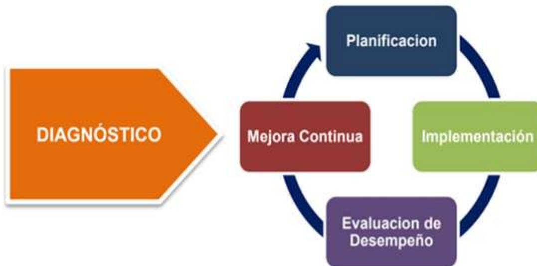
Figura 1 Ciclo de operación del Modelo de Seguridad y Privacidad de la Información 1

A continuación, se muestra el ciclo de operación del MSPI expresando cada fase y porcentaje que dicha fase tiene en el desarrollo o cumplimiento del 100% de la implementación del MSPI en la Alcaldía de Pereira.