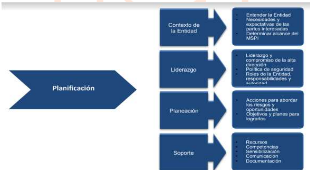
Figura 4 Fase de planificación 5

En esta fase lo más importante es entender el contexto de la entidad y así generar acciones que suplan las necesidades y que estos procesos estén razonables a la realidad de la capacidad humana y económica para dicha implementación del MSPI. También demuestra el compromiso de la alta dirección para la implementación de este mediante la Política General de Seguridad y Privacidad de la Información.