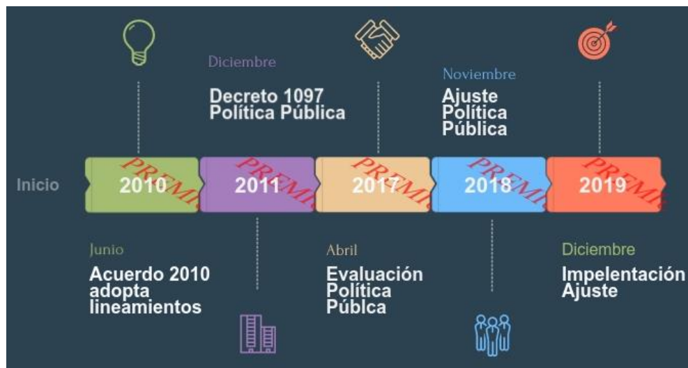
Tabla 1. Estructura general y despliegue estratégico

En el año 2018 la política pública fue ajustada mediante un ejercicio técnico y metodológico realizado de manera conjunta por las Secretarías de Gobierno y Planeación. El ajuste fue aprobado en el Consejo de Política Social en noviembre del 2018 y legalizado mediante el decreto 512 del 5 de julio de 2019.