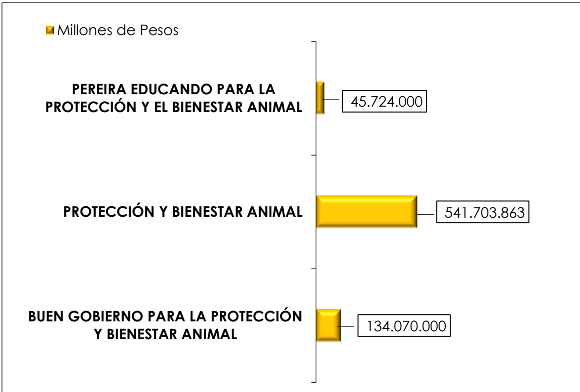
Gráfico 2. Inversión realizada por Componente de la Política Publica de Protección y Bienestar Animal año 2020

Como se indicó anteriormente La Política de Protección y Bienestar Animal realizó una inversión total de $ 721.497.863 pesos en el año 2020, valor que equivale a las siguientes inversiones por componente: a) Protección y Bienestar Animal presentó la mayor inversión de $ 541.703.863 pesos, b) Buen Gobierno para la Protección y Bienestar Animal con una inversión $ 134.070.000 pesos en la ejecución de sus 10 acciones, y finalmente, el componente Pereira Educando para la Protección y el Bienestar Animal con una inversión de $ 45.724.000 pesos en el cumplimiento de sus 8 acciones (ver Gráfico 2.)