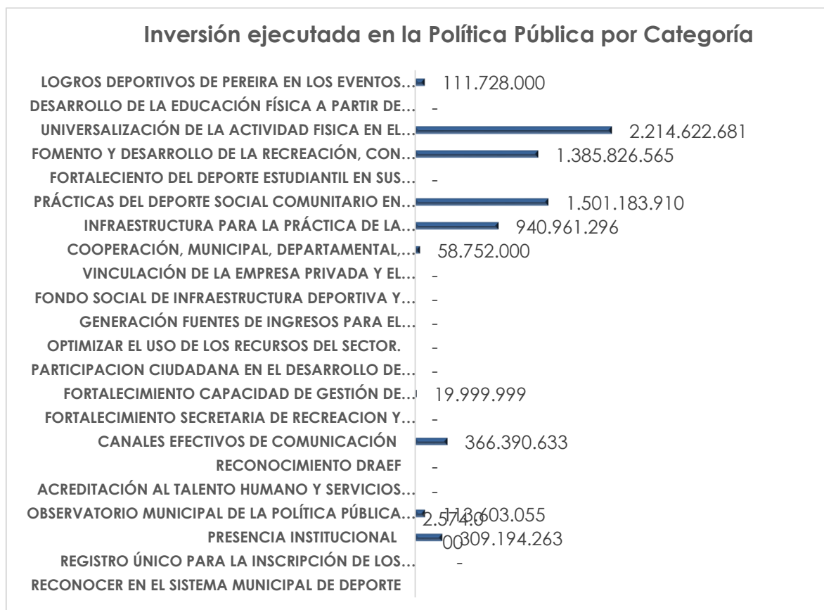
Gráfico 3. Ejecución Presupuestal por Categoría Política Pública DRAEF