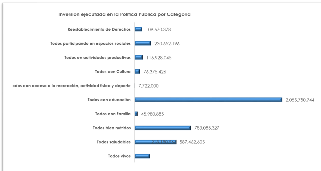
Gráfico 3 Ejecución Presupuestal por Categoría Política Pública Juventud