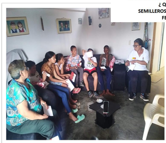
REGISTRO FOTOGRAFICO ACTIVIDAD FORMATIVA ¿ QUE ES EL DENGUE ? SEMILLEROS JUVENILES SECTOR TOKIO 4 FECHA: 15/09/2022