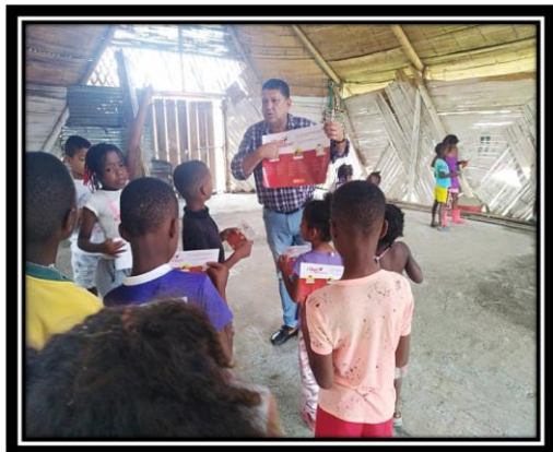
REGISTRO FOTOGRAFICO ACTIVIDAD FORMATIVA ¿ QUE ES EL DENGUE ? SEMILLEROS JUVENILES SECTOR PLUMON #1 FECHA: 22/09/2022