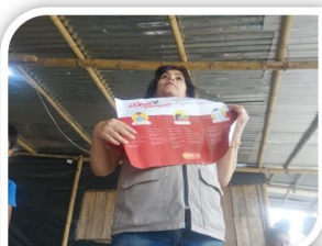
REGISTRO DE ASISTENCIA ACTIVIDAD FORMATIVA ¿ QUE ES EL DENGUE ? SEMILLEROS JUVENILES SECTOR PLUMON # 3 FECHA: 22/09/2022