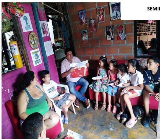
REGISTRO FOTOGRAFICO ACTIVIDAD FORMATIVA ¿ QUE ES EL DENGUE ? SEMILLEROS JUVENILES SECTOR LA LOMA FECHA: 10/09/2022;