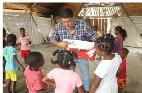
REGISTRO DE ASISTENCIA ACTIVIDAD FORMATIVA ¿ QUE ES EL DENGUE ? SEMILLEROS JUVENILES SECTOR PLUMON #2 FECHA: 22/09/2022