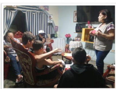
ACTIVIDAD FORMATIVA ¿ QUE ES EL DENGUE ? SEMILLEROS JUVENILES SECTOR EL DORADO FECHA: 05/09/2022; HORA :6:15 PM