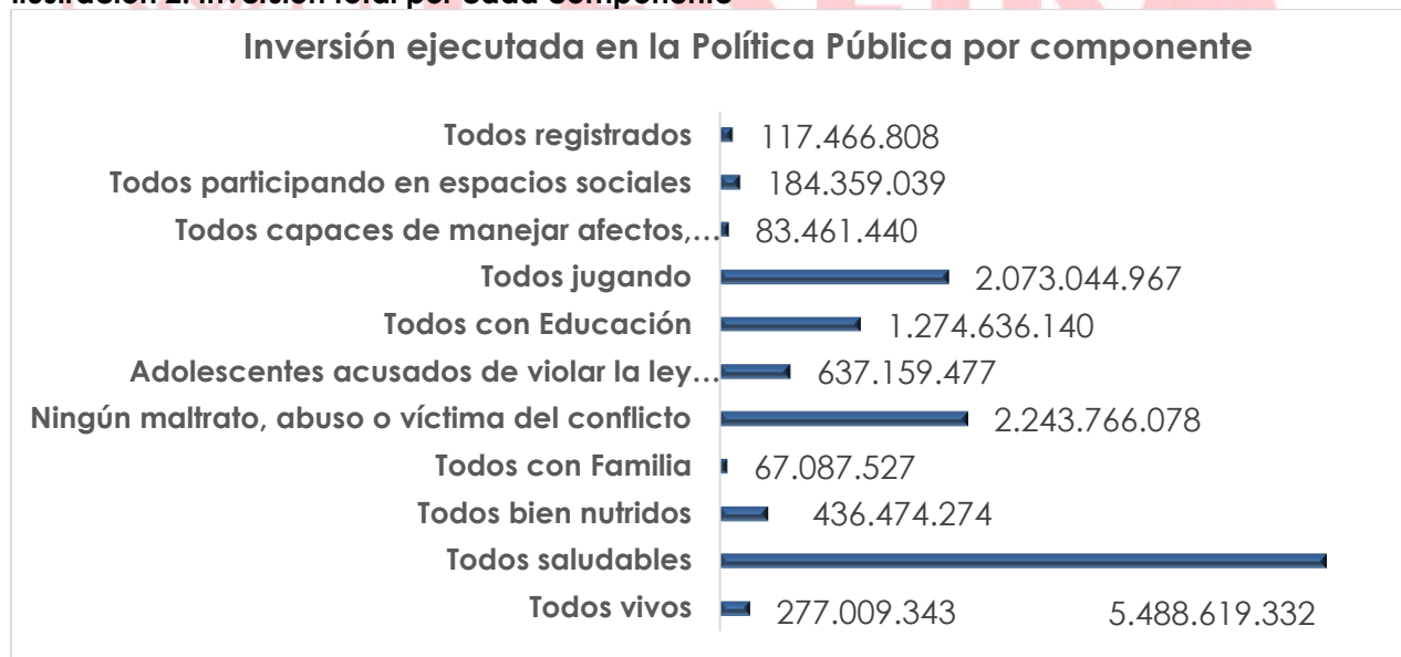
Ilustración 2. Inversión total por cada componente