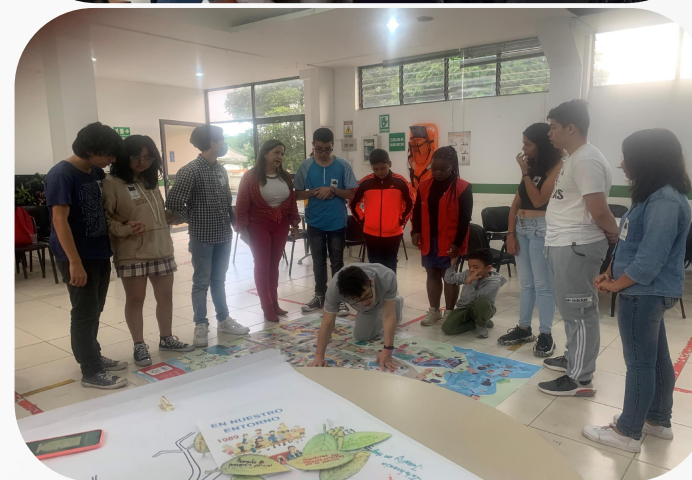
FOTOS EN LA SOCIALIZACIÓN Y APROBACIÓN DEL PLAN DE ACCIÓN EN LA MESA DE NNA