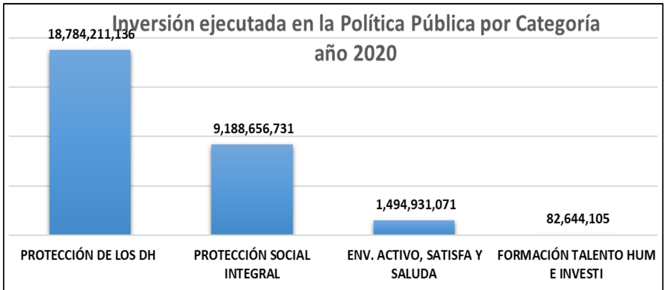
Gráfica 1. Inversión por categoría.

En la gráfica se observa que la categoría que mayor presupuesto ejecutado tiene en el año 2020, es la de Protección de los derechos humanos, con un total de $18.784.211.136, logrando un porcentaje de avance del 63%, en esta categoría se encuentran 14 de las 49 acciones que contiene la política. La categoría con menor presupuesto ejecutado es Formación talento humano e investigación, con $82.644.105 con un total de 14 acciones logrando un porcentaje de avance del 54%. La Inversión total para el año 2020 fue de $29.550.443.042.